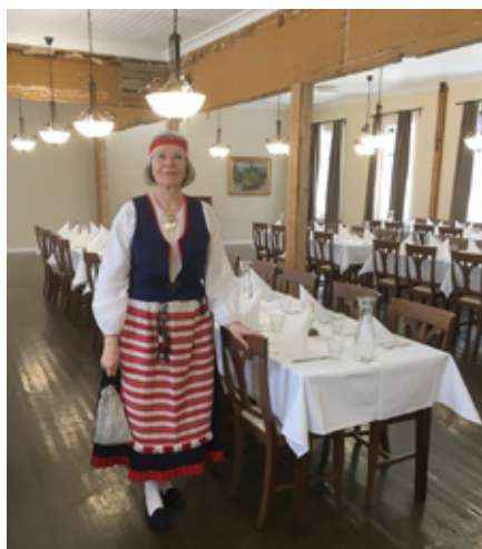
Historia ja perinteet kiinnostavat.

neiksi) ja karjalaisuuteen liittyvissä yhteisöissä, tärkeimpänä niistä Lahden Torkkelin Kilta, joka vaalii Viipurin perintöä ja ylläpitää karjalaisten kotiseututunnetta.