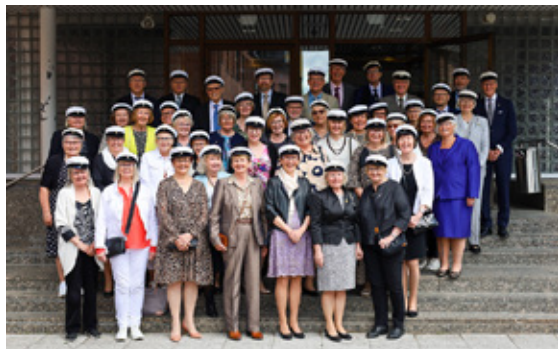
Vuoden 1973 ylioppilaaat kokoontuivat luokkakokoukseen riemu ylioppilaina keväällä 2023.