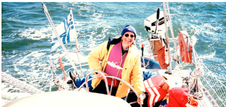
Suomenlahdella, kesä 1998.

Työtä riittää ja joku voisi ajatella, että näin pitkällä kokemuksella asiat hoidutvat vanhalla rutiinilla. Se ei kuitenkaan pidä paikkaansa, vaan uutta pitää opetella jatkuvasti ja esimerkiksi uuden tekniikan omaksuminen antaa omat haasteensa työhöni.