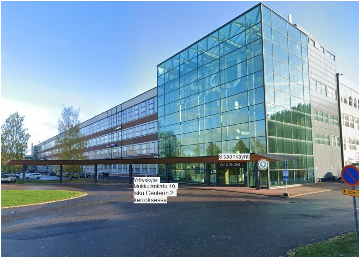
↑ Isku Center, sisäänkäynti Yrityskylään.